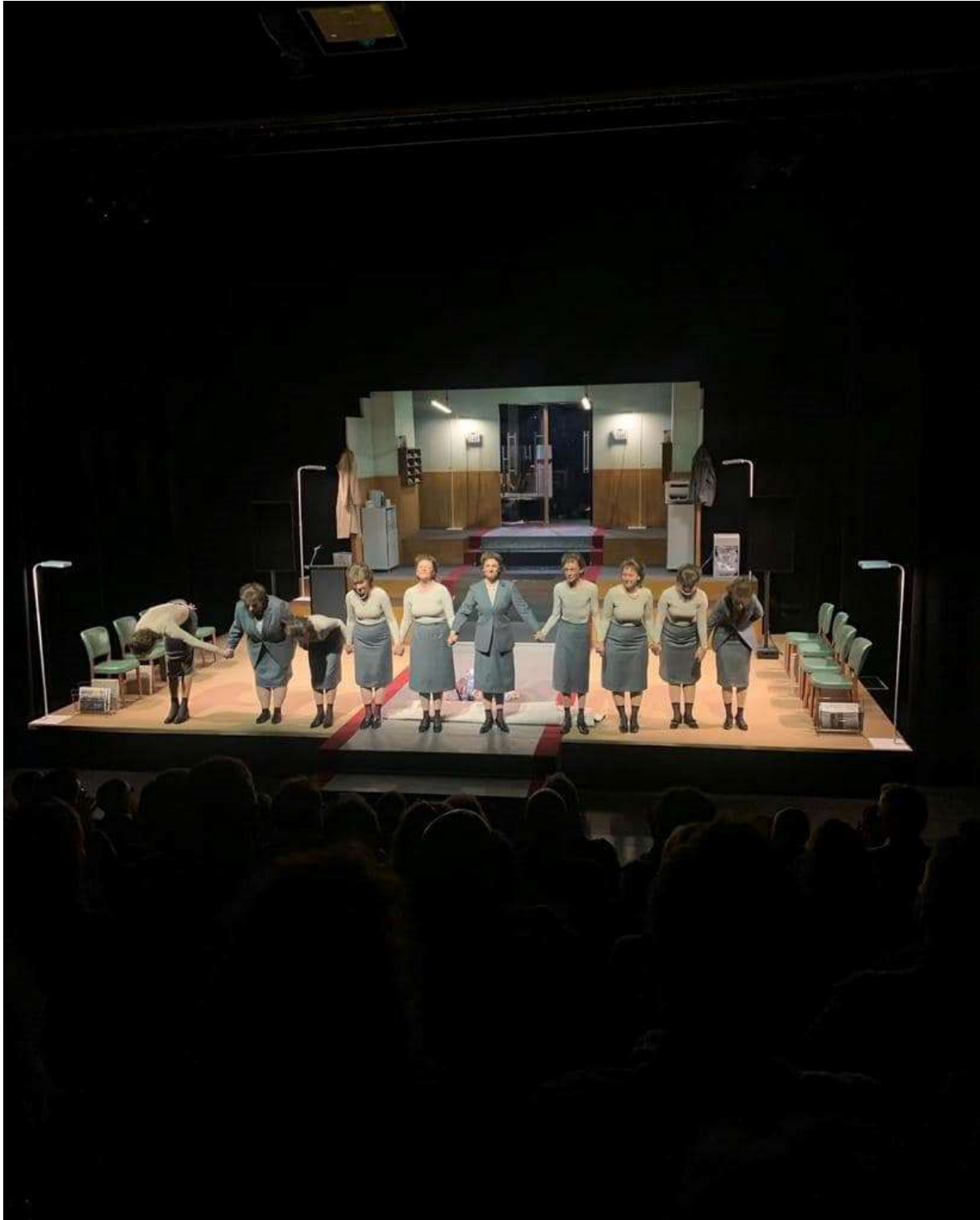
EWS – DER EINZIGE POLITTHRILLER DER SCHWEIZ