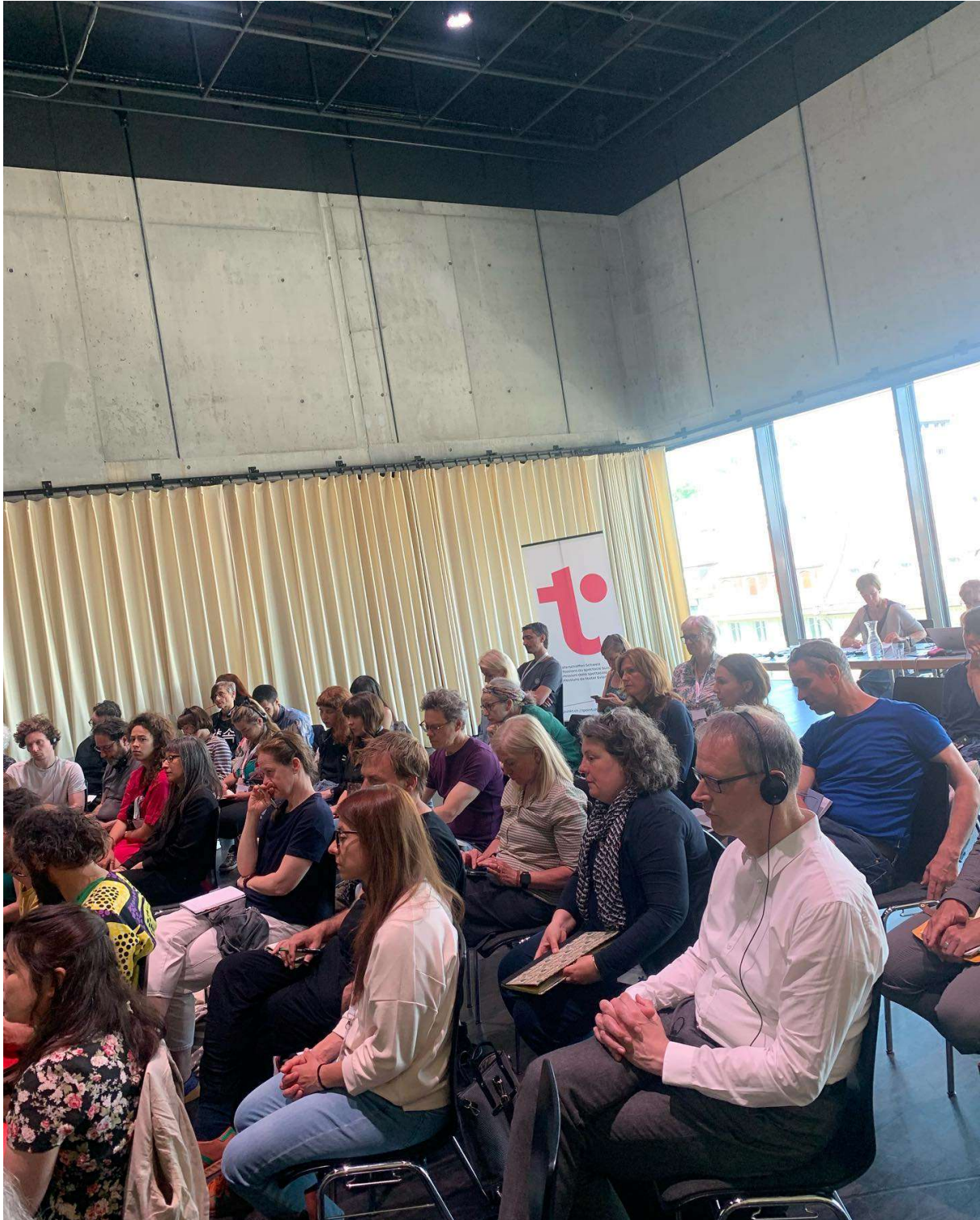
MUTATION dans le domaine des rémunérations indicatives : Salaires, cachets, questions d'argent. Table-ronde organisée conjointement avec t. Professions du spectacle suisse